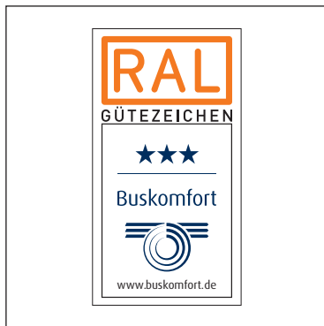
Standard-Plakette mehrfarbig (mit weißem Hintergrund)