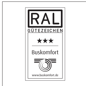
Standard-Plakette (mit weißem Hintergrund)