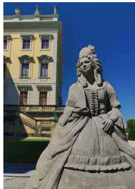
Sandkünstler machen im Sommer im Blühenden Barock eine gute Figur.

Die Strohwelten-Ausstellung dreht sich in diesem Jahr um das Thema „Arche Noah“. Der künstlerische Leiter der Strohwelten, Jeroen van de Vlag, erschafft mit seinem Team eine imposante Arche und zahlreiche Tierpaare. Vielfältige Veranstaltungen wie die Stroh-Olympiade versprechen Spaß und Spannung.