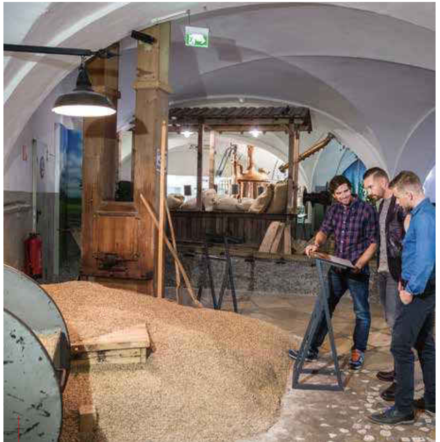
Die Ausstellung in der Stiegl-Brauwelt führt den Besucher auf einer Fläche von mehr als 5.000 Quadratmetern in die Kunst des Bierbrauens ein.

Im Braushop findet der Bierfreund allerlei bierige Accessoires wie Shirts, Bücher, Gläser und saisonabhängige Produktschmankerl der Bierwelt. Ein Highlight im Shop ist die Stiegl-Fashion, die als Damen- und Herren-Kollektion jeweils in den drei Linien Fashion, Klassik und Sport angeboten wird. Hier reicht die Palette von klassisch-legerer Freizeitmode über trendige Basics bis zu funktioneller Sportbekleidung. Abgerundet wird das modische Sortiment mit passenden Accessoires wie Strickmützen, Gürtel, Schals, Tüchern und Taschen. GR