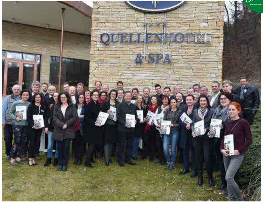
Ein attraktives Netzwerk: Über 16 unabhängige Hotels und 47 Ausflugsziele spiegeln die Bandbreite des Angebots von Busreisen Steiermark wider.

Die Feistritzalbahn gehört zu den neuen Mitgliedern von Busreisen Steiermark. Die Bahn ist über 100 Jahre alt und wurde am 15. Dezember 1911 eröffnet. Ihre Strecke ist 24 Kilometer lang. Arbeiter aus der Türkei, Italien und Slowenien haben sie in nur 27 Monaten gebaut, außerdem noch vier Bahnhöfe, drei Tunnel und neun Viadukte. Die Trassenverlängerung nach Ratten (18 Kilometer) ist heute ein Radweg.