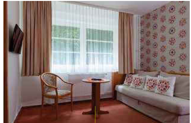
48 modern ausgestattete Zimmer machen den Aufenthalt im Waldhotel Am Ilsestein zu einem Genuss.