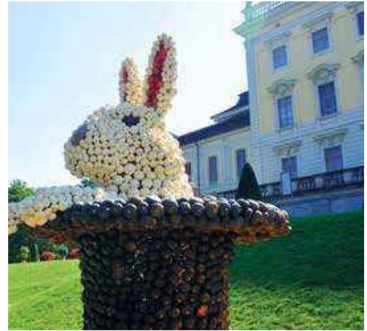
Im Herbst entdecken die Besucher des Blühenden Barocks ganz neue Tierarten, wie diesen Kürbishaasen.

Aus über 450.000 Kürbissen entstehen Tierkulpturen und schöne Waldszene. Dazu gibt es wie in jedem Jahr eine immense Auswahl an Kürbissen und feinste Leckereien wie Kürbiskernpesto oder Kürbissekt und vieles mehr im Kürbisshop.