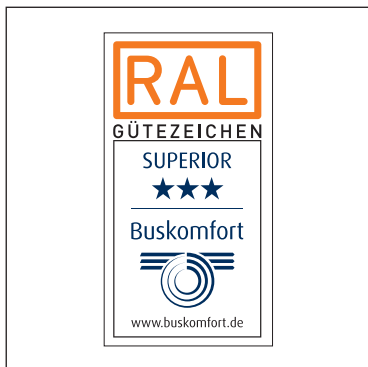
SUPERIOR-Plakette mehrfarbig (mit weißem Hintergrund)