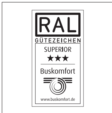
SUPERIOR-Plakette (mit weißem Hintergrund)